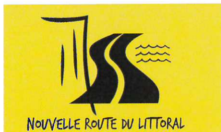
NOUVELLE ROUTE DU LITTORAL

- fond jaune : zone d'exclusion de 200 mètres.