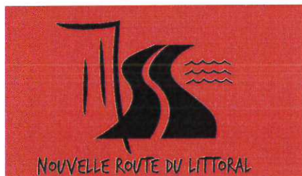
NOUVELLE ROUTE DU LITTORAL

- fond rouge : zone d'exclusion de 500 mètres.