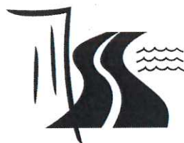
NOUVELLE ROUTE DU LITTORAL

- fond blanc : permettant aux unités de contrôle de l'Etat en charge de la surveillance de l'application de l'arrêté ou autres usagers d'identifier les navires participants aux chantiers de la NRL